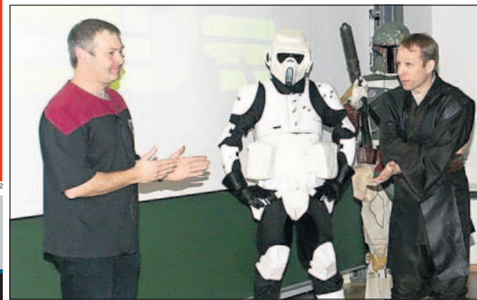
Die Zweibrücker „Star Trek“-Weihnachtsvorlesungen sind seit vielen Jahren Kult.

Weihnachtsvorlesung am 16. Dezember an FH Zweibrücken vereint zwei TV-Kultserien